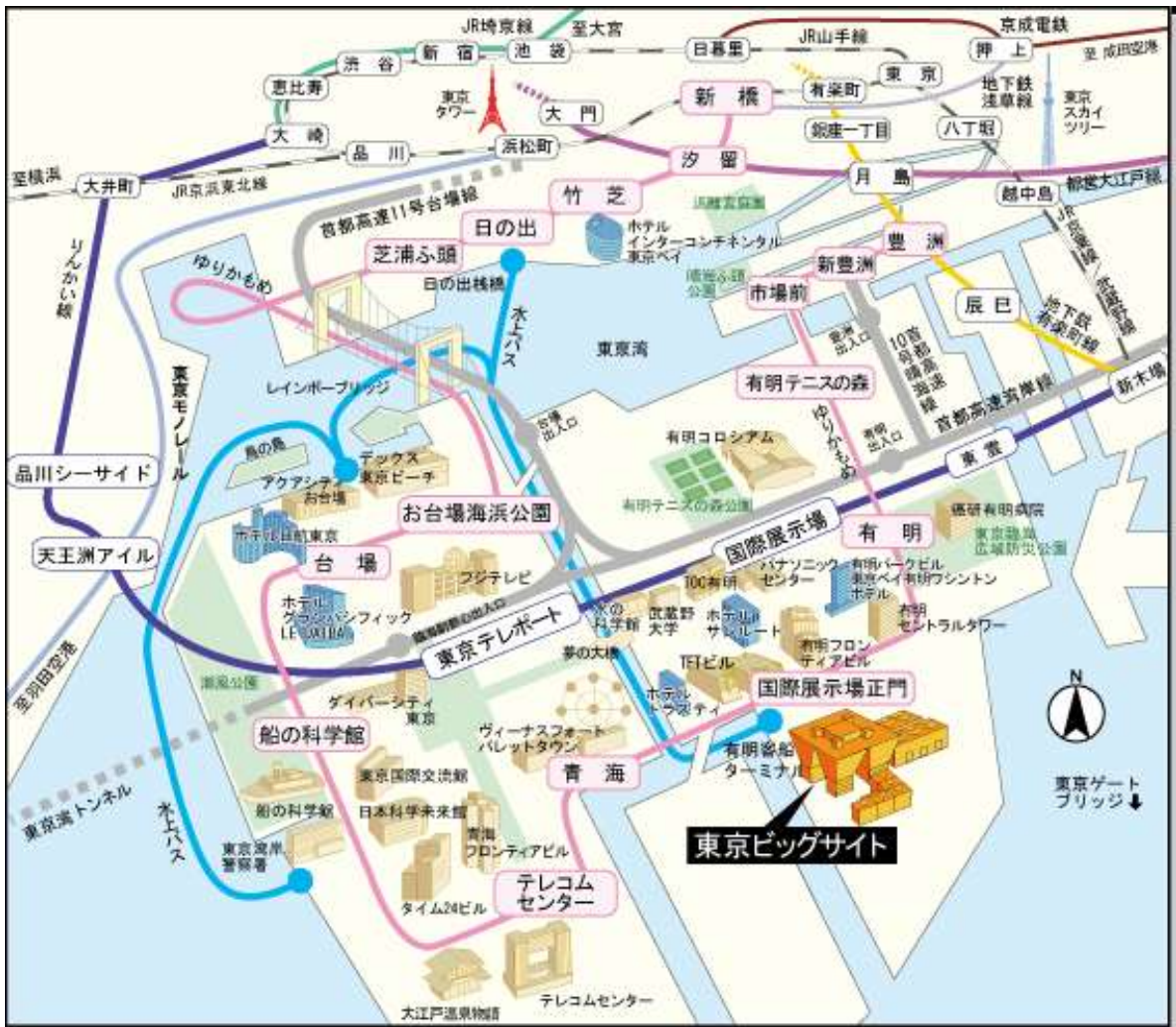
(案内図) 東京ビッグサイト (東京都江東区有明3-11-1、(株)東京ビッグサイト・TEL: 03-5530-1111)